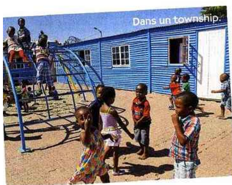
Dans un township.