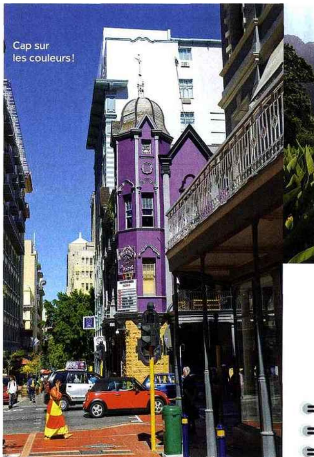
Cap sur les couleurs!

Pas faux! C'est une ville branchée, à la population décontractée et festive. Avec ses concept stores, ses musées, son patrimoine architectural, ses plages, son climat de rêve (météo idéale entre décembre et mars), elle est plébiscitée par les photographes de mode et sera capitale internationale du design en 2014. Tous les premiers jeudis du mois, les galeries d'art sont ouvertes le soir : on dîne entre sculptures et tableaux au resto de la galerie Young Blood Africa (70-72, Bree Street). On assiste à des pièces de théâtre, concerts ou comédies musicales comme le « Rocky Horror Show » au Fugard Theatre, situé dans une ancienne église. Sur le toit du Grand Daddy Hotel ( www.granddaddy.co.za ), on dort dans des trailers en alu des 50's à la déco personnalisée et, le lundi, il y a séance de ciné en plein air, avec distribution de couvertures, bonbons et pop-corn. Enfin, Le Cap est ouvertement gay friendly (gay pride en mars) !