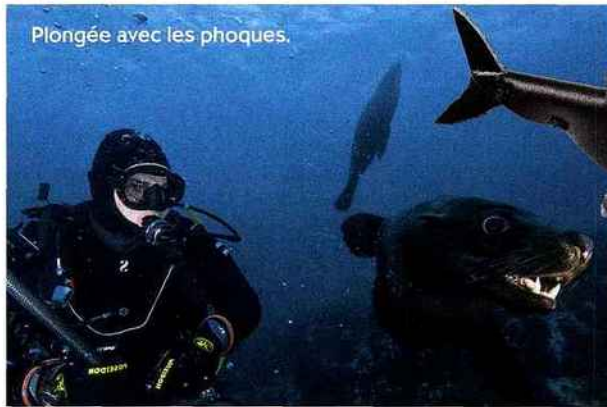
Plongée avec les phoques.