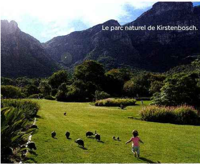
Le parc naturel de Kirstenbosch.