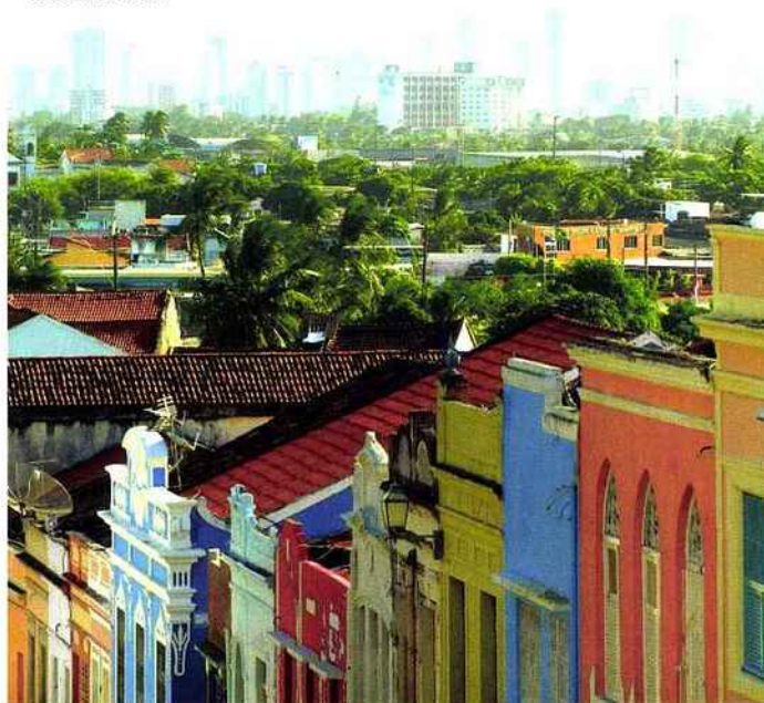
Olinda, un petit bijou colonial dans le Pernambuco.

aseptisé du Brésil "allemand," à l'extrême sud.